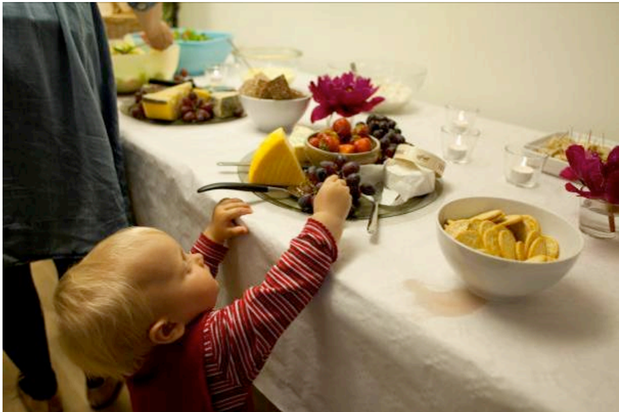
Jubileumsfest: Den nye FIAN-generasjonen har matvett.