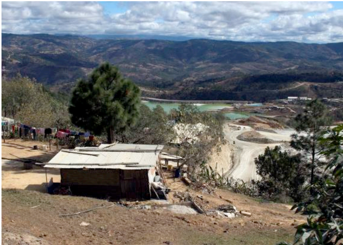
Slamdepoet i Marlin-gruven (januar 2012).